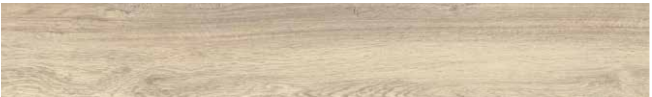
Baltic Oak Art.-Nr. 80001902 (KSYF001)