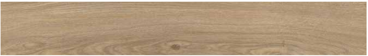
Land Oak Art.-Nr. 80001901 (KSYC001)