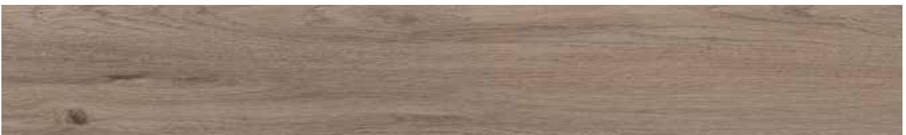
Ash Oak Art.-Nr. 80001904 (KSYM001)