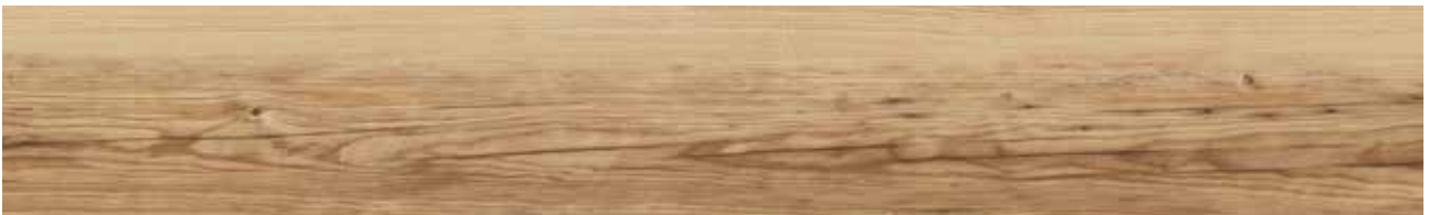
Castle Oak Art.-Nr. 80001900 (KSYB001)