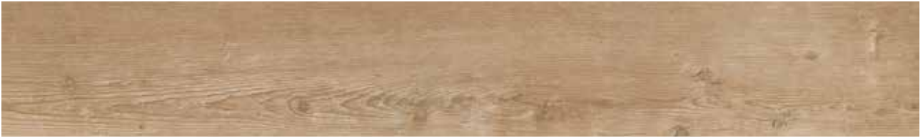
Cliff Oak Art.-Nr. 80001899 (KSYA001)